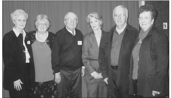
Dîner bénéfice du 13 novembre 2003

Merci de soutenir la Fondation qui porte le nom de la plus grande syndicaliste du 20 e siècle.